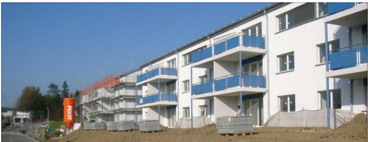
Au premier plan bâtiment E et au second plan bâtiment F