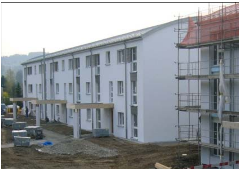
Façades côté Nord-Ouest, aménagements extérieurs en cours