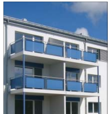
Balcons terrasses façade côté Sud-Est