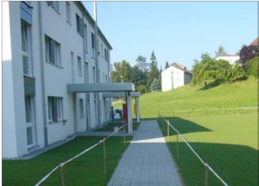
Entrées dans bâtiment F côté Nord-Ouest

Pasquier-Glasson SA Architecte EPFL-SIA Rue du Marché 12 Case postale 171 1630 Bulle