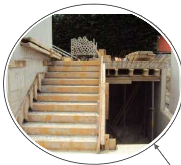
Projet - situation