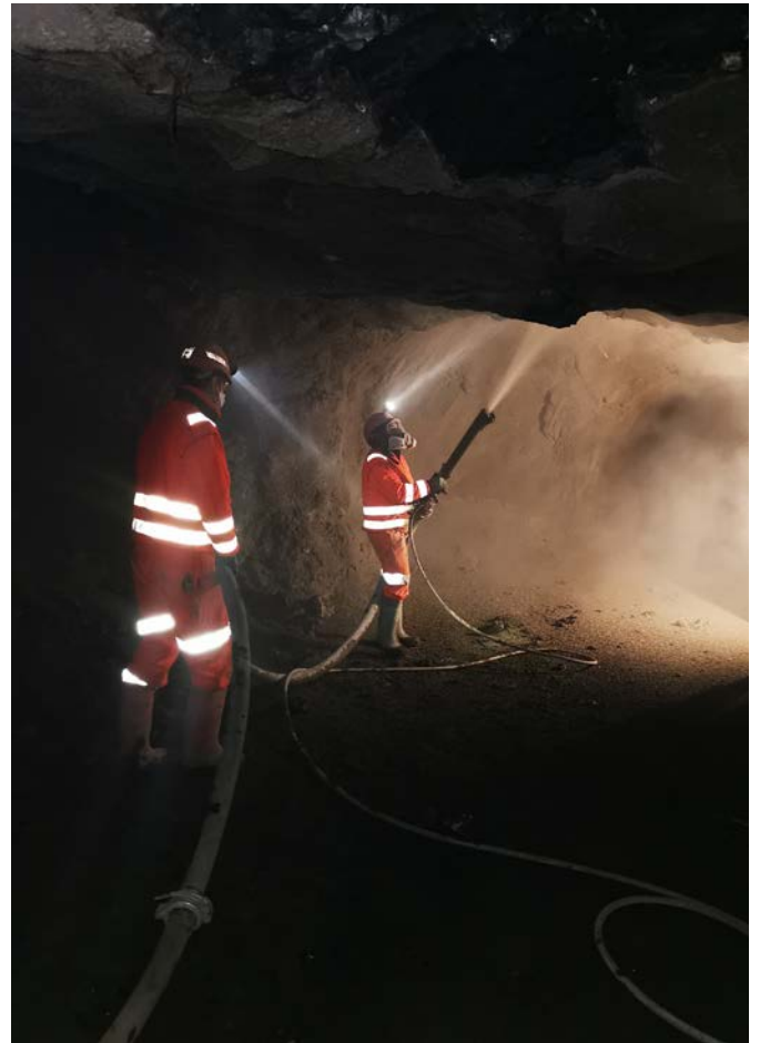
Béton projeté de sécurisation