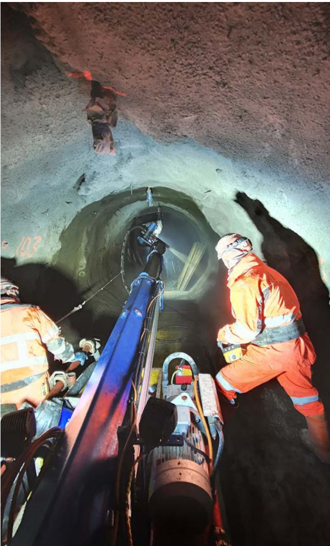
Revêtement périphérique avec du béton projeté fibré métallique