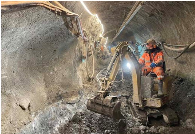
Marinage des déblais vers l'extérieur