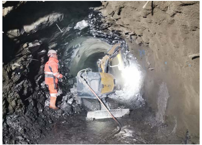
Abattage du rocher