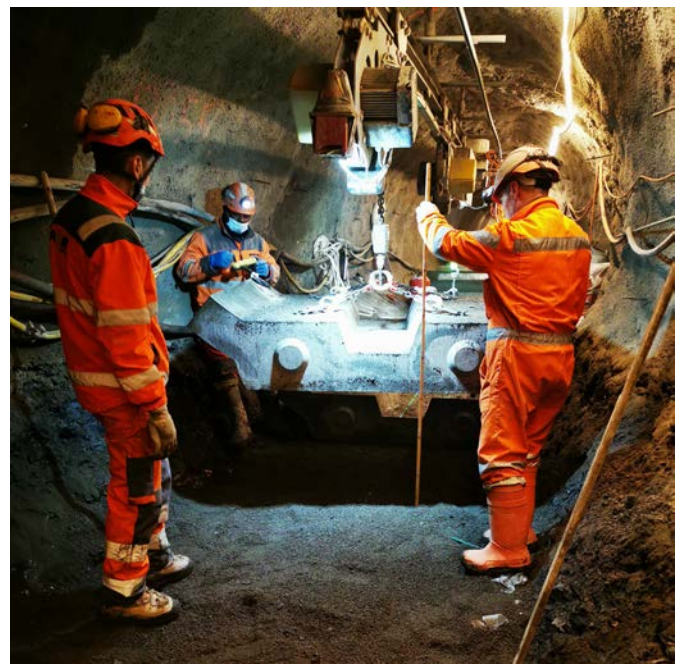
Pose des éléments préfabriqués du radier