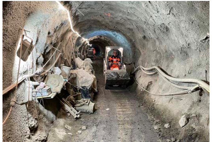
Marinage des déblais vers l'extérieur