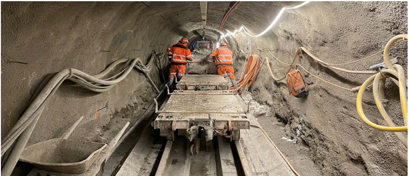
Transport des déblais vers l'extérieur